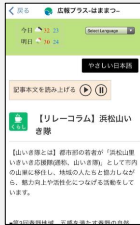
広報プラスはままつ／「やさしい日本語」変換にも対応可能