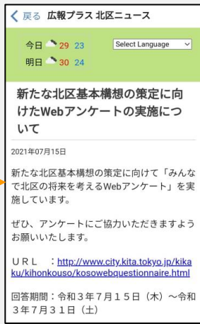
広報プラス 北区ニュース／お知らせから アンケート 誘導も可能